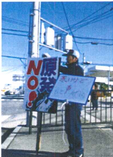
(第1回抗議宣伝行動)